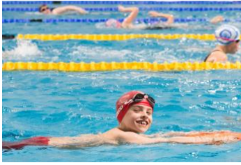
Open water, seizoen 2019-2020, Clubkampioenschappen, Officials, afscheid en einde seizoen 2018-2019